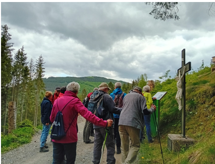
07.05.2025 Mittwochswanderung für Rüstige

Allen Wanderfreundinnen und -freunden, die infolge Krankheit am aktiven Vereinsleben nicht teilnehmen können, entbieten wir ein herzliches „FRISCH AUF“ mit den besten Wünschen für baldige Genesung.