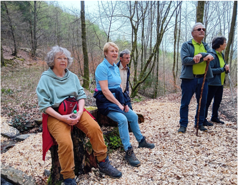
16.04.2025 Mittwochswanderung für Jedermann