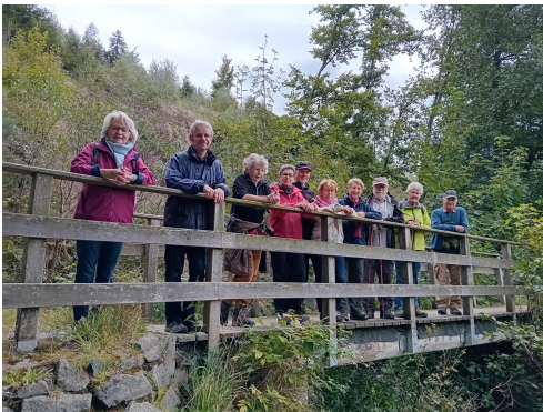
17.09.2025 Mittwochswanderung für Jedermann