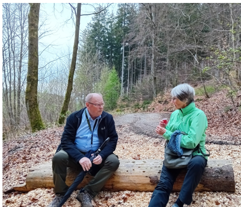
16.04.2025 Mittwochswanderung für Jedermann

Bitte beachten Sie bei allen Wanderungen und Veranstaltungen die Ankündigungen in der Presse!