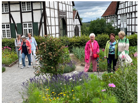
06.07.2025 Kulturfahrt nach Detmold