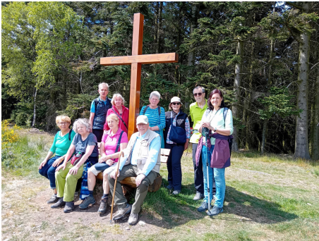
21.05.2025 Mittwochswanderung für Jedermann