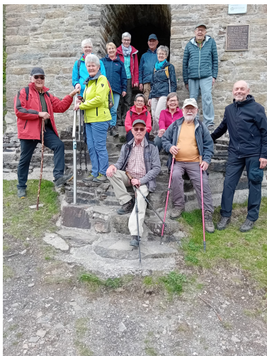
07.05.2025 Mittwochswanderung für Rüstige