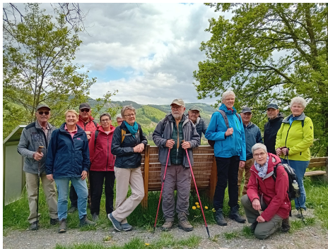
07.05.2025 Mittwochswanderung für Rüstige