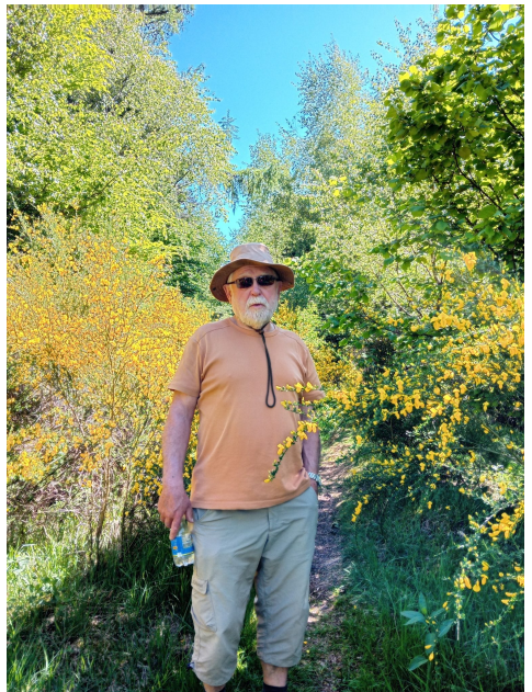
21.05.2025 Mittwochswanderung für Jedermann