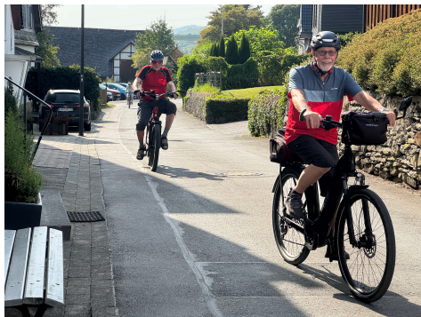
13.08.2025 Radtour für „Ältere Radler“

Beginn 14.00 Uhr an der Skihütte an der Talstraße, Olsberg. Ankündigung in der Presse beachten!