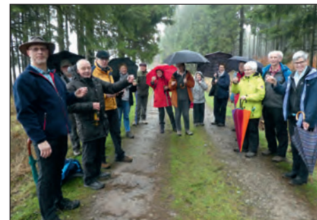
Altenbürener Mühle - Eröffnungswanderung

Mittwoch, 18. April Wanderung für Jedermann