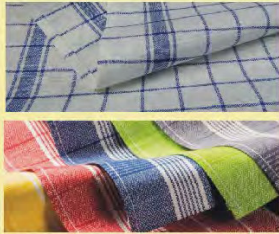
Küchentücher Baumwolle Halbleinen Frottier