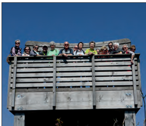
Höhenflug: Medelon - Hallenberg am 9. 4. 2017

Dienstag, 15. Mai Gesundheitswandern in Nuttlar 13.30 Uhr Tour 1 moderat 15.30 Uhr Tour 2 sportlich