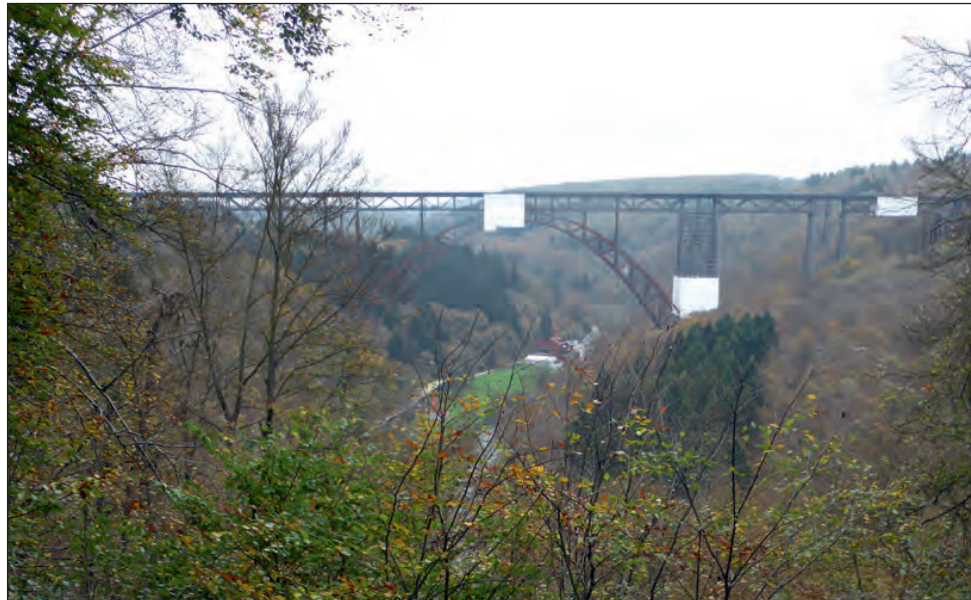
Münstener Brücke Solingen-Schaberg

Treffpunkt: 7.15 Uhr Bahnhof Bestwig mit der Bahn nach Altenbeken. Eisenbahngeschichte auf dem Viadukt