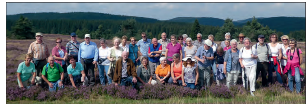
Jedermann-Wanderung auf der Hochheide Niedersfeld

Dienstag, 7. August Gesundheitswandern 13.30 Uhr Tour 1 moderat 15.30 Uhr Tour 2 sportlich