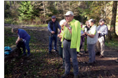
Rumbeck am 28. 10. 2017