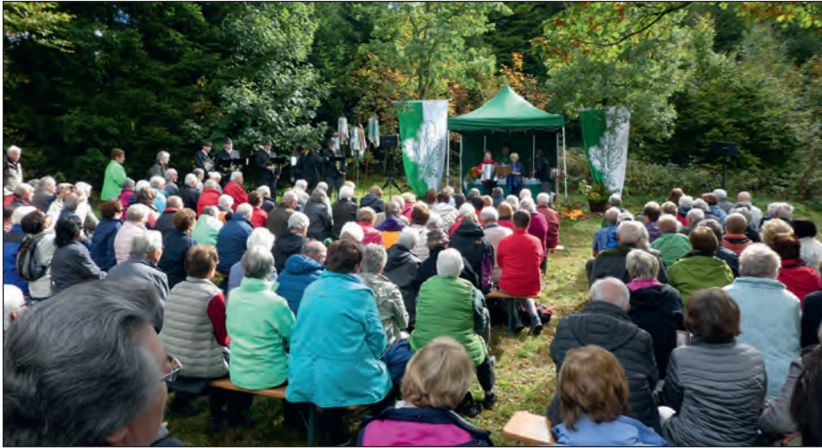
Am Großen Bildchen