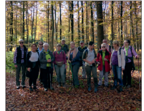
Höhenflug am 15. 10. 2017

13.30 Uhr Abschluss Tour 1 für beide Gruppen mit anschließendem Kaffeetrinken in der SGV-Hütte Nuttlar